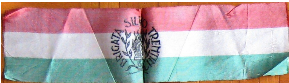
Fascia da braccio della Brigata "S. Trentin" durante l'insurrezione (Esposizione permanente CASREC unipd)

La Brigata "Trentin" si riorganizzò a stento, ma a febbraio riprese le attività e fu tra le formazioni protagoniste dell'insurrezione, che a Padova avvenne tra il 26 e il 28 aprile 1945.