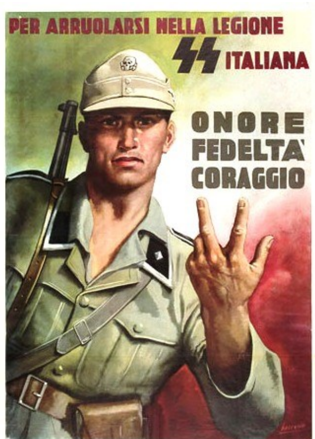
Manifesto propagandistico della Repubblica Sociale Italiana