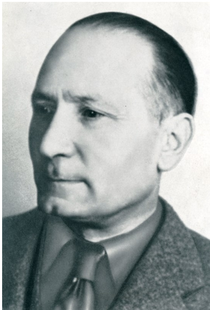
Silvio Trentin

I nuclei divennero squadre, che si moltiplicarono col passare dei mesi diventando battaglioni, alcuni con carattere di piccole formazioni militari permanenti, fino a costituire la famosa Brigata Guastatori Giustizia e Libertà , che fu intitolata a Silvio Trentin (1885-1944), il grande antifascista e federalista arrestato a Padova il 19 novembre 1943 e morto il 12 marzo 1944.