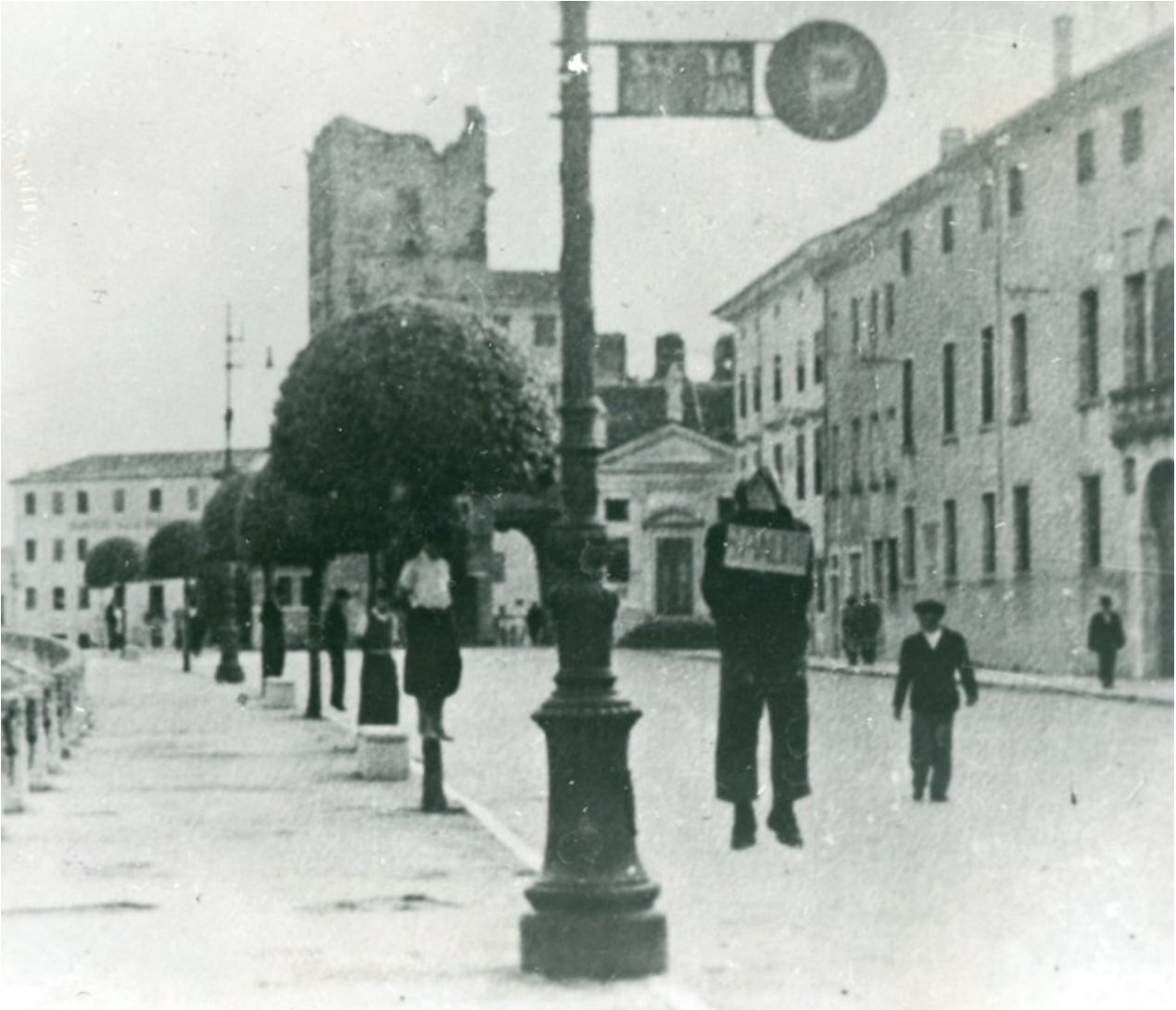
Partigiani impiccati a Bassano del Grappa il 26 settembre 1944

Nonostante le accresciute difficoltà, le azioni continuarono: il 25 settembre vennero interrotte in più punti le linee ferroviarie Padova – Piazzola e Padova – Bologna, fu fatto saltare un traliccio dell’alta tensione e in città fu incendiato il magazzino del 58° fanteria.