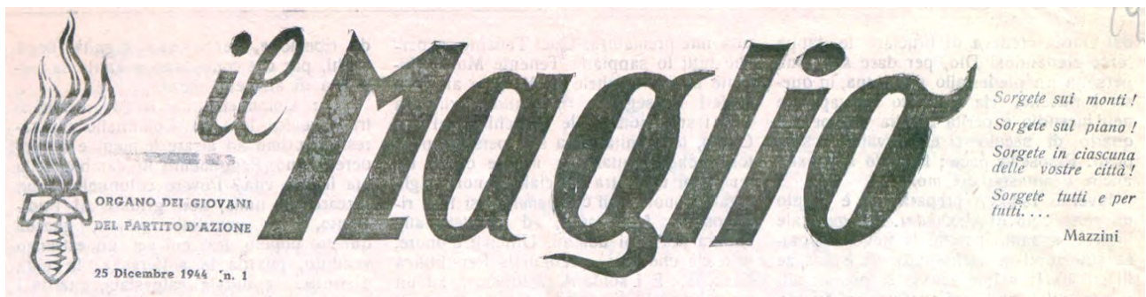
La testata dell'organo dei giovani del Partito d'Azione "il Maglio" edito da "Renato"

Invece Zamboni e Pighin, animati da grande amore per la Patria e spinti da un forte senso del dovere di stampo mazziniano, avevano fatto proprie le esortazioni del grande Patriota ottocentesco, evidenziandole anche nella testata de "il Maglio", il giornale dei giovani del Partito d'Azione di cui Pighin fu promotore, redattore e diffusore.