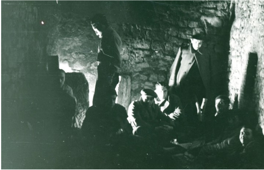
Partigiani in attesa di entrare in azione