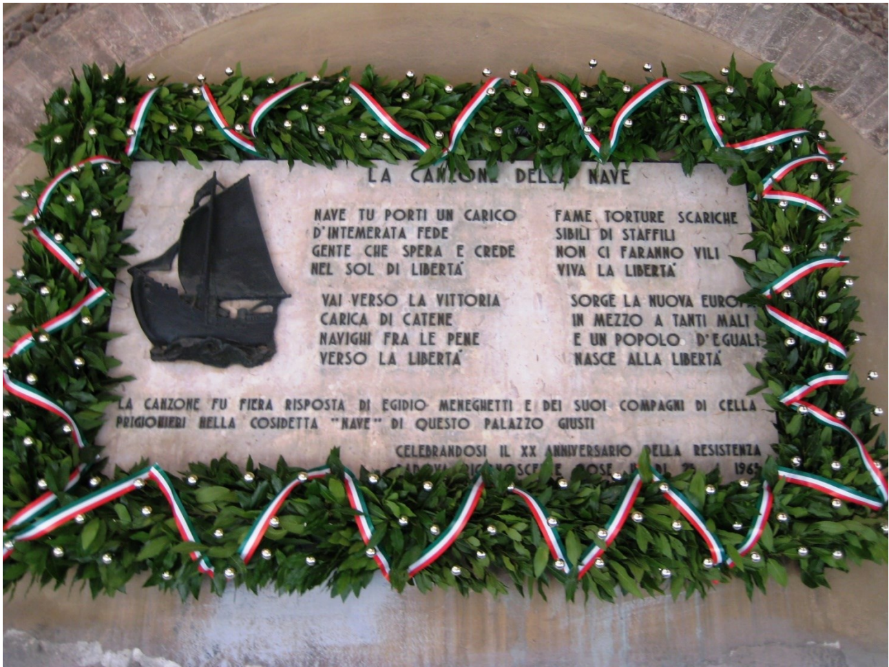
Lapide commemorativa sulla facciata di Palazzo Giusti in via S. Francesco a Padova.