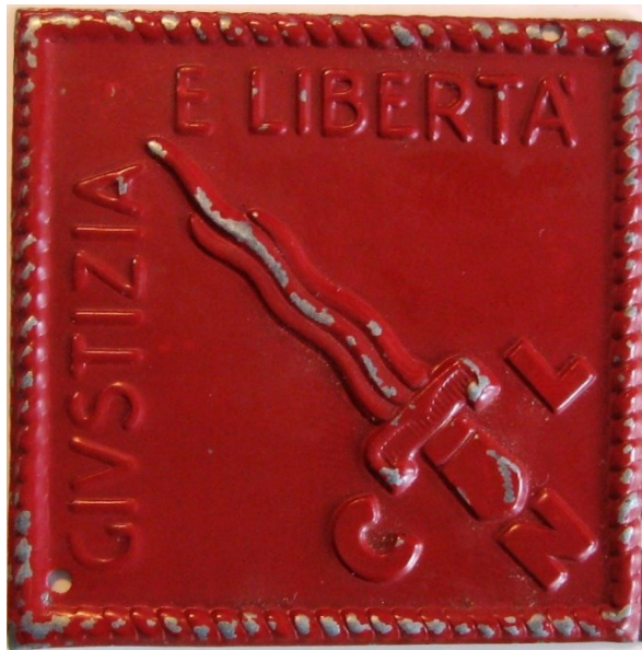
Distintivo dei Partigiani del Partito d'Azione – Giustizia e Libertà (Esposizione permanente CASREC unipd)

In breve tempo il crescente successo delle varie destre conservatrici, qualunquiste, populiste e neofasciste fece apparire non infondato il timore, espresso da “Renato” nel film a lui dedicato, che «dopo che tutto questo sarà finito... ci sarà di nuovo un periodo in cui la gente si lascerà addormentare, anestetizzare da un po' di pace e di abbondanza... e magari si sarà pronti a lasciar perdere tutto un'altra volta, la libertà un'altra volta» .