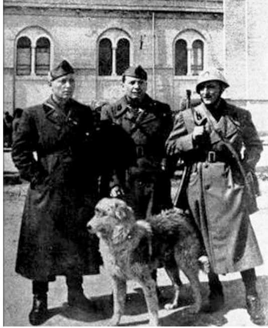
Il maggiore Mario Carità (al centro), comandante del Reparto Servizi Speciali (foto di pubblico dominio)

Giunta a Padova, la “Banda Carità” divenne il braccio operativo nel Padovano della Sicherheitsdienst (SD) , la polizia di sicurezza nazista, e fu posta alle dipendenze, col nome di Battaglione Speciale Italiano, dell' Aussenkommando AK Padova , che aveva sede nella ex casa di cura di via Diaz ed era comandato dallo SS-Sturmbannführer Friedrich Bosshammer (1906-1972). Il maggiore Bosshammer aveva un aspetto insignificante ma il suo Stato di servizio era impressionante: convinto antisemita, alle dipendenze del famigerato colonnello Adolf Eichmann, come Judenreferent della Sezione IV-B4 aveva teorizzato, pianificato e realizzato la “soluzione finale” della “questione ebraica” in Europa sudorientale e poi in Italia.