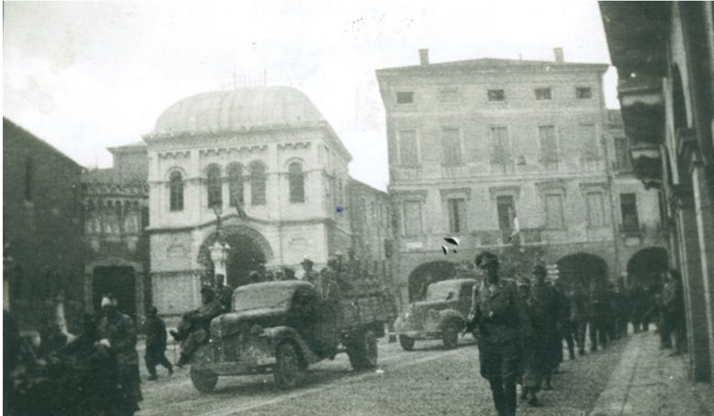
Truppe tedesche lasciano Padova dopo la resa